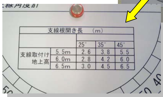
支線角度早見表追加