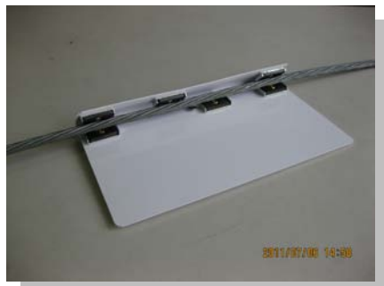
マグネット数量、取付形状変更