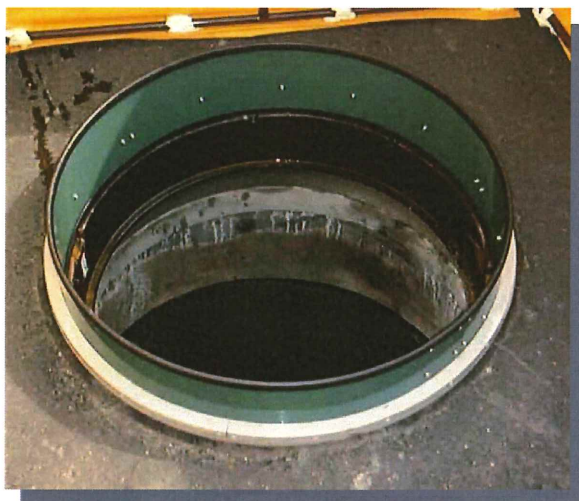
NTT新型マンホール取付け状態