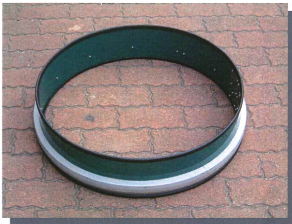
NTT新型マンホール用 防水枠